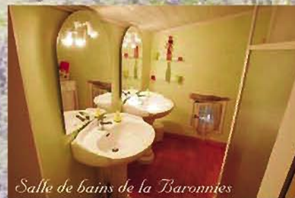
Salle de bains de la Baronnies