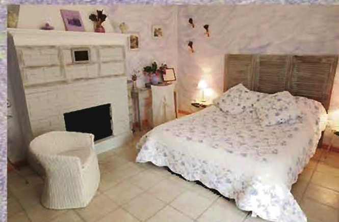
Les 2 chambres de la suite Mirmande